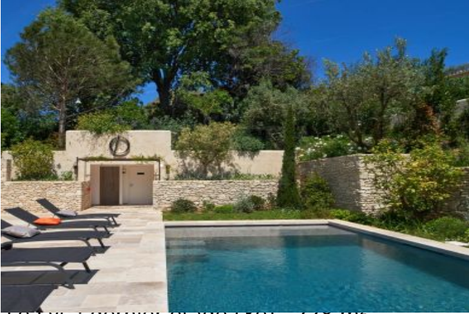
Le Lys : dernier étage (5e), 228 m 2 habitables, terrasse 48 m 2 , 2 950 000 €

havre de paix pour se reposer et profiter du climat exceptionnel de la Côte d'Azur.